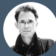
Уильям Форд Гибсон писатель-фантаст

“ Будущее уже наступило. Просто оно еще неравномерно распределено