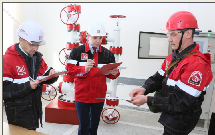
Эксперты на практическом экзамене