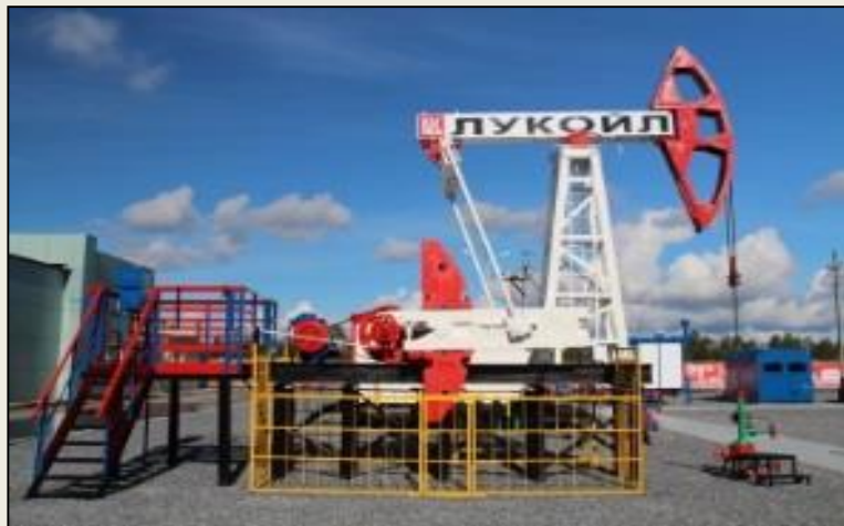
Когалымский политехнический колледж