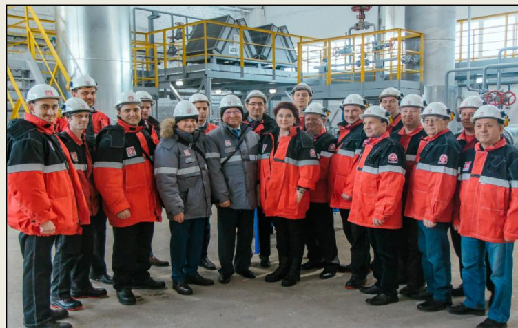
Эксперты ООО «ЛУКОЙЛ-Пермнефтеоргсинтез»