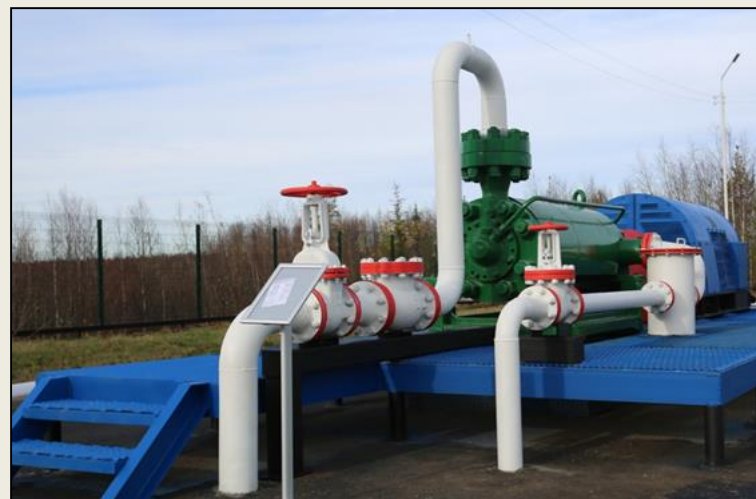
Учебный центр Ухтинского государственного технического университета в Усинске