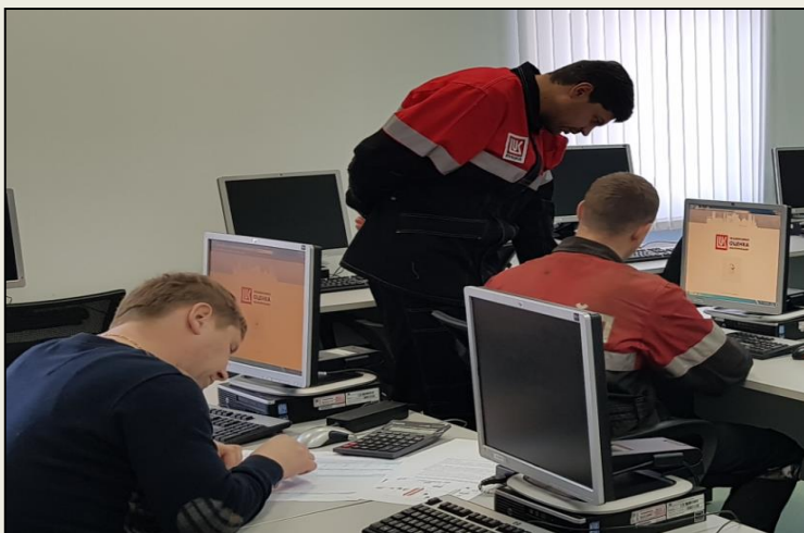
Эксперт на теоретическом экзамене