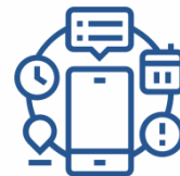
Система «Умный дом»