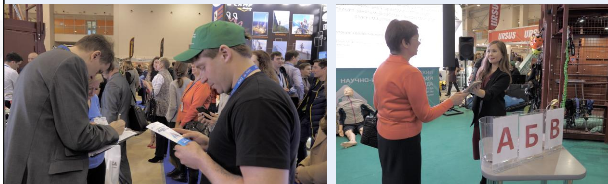
Международная выставка лифтов и подъемного оборудования Russian Elevator Week 2019