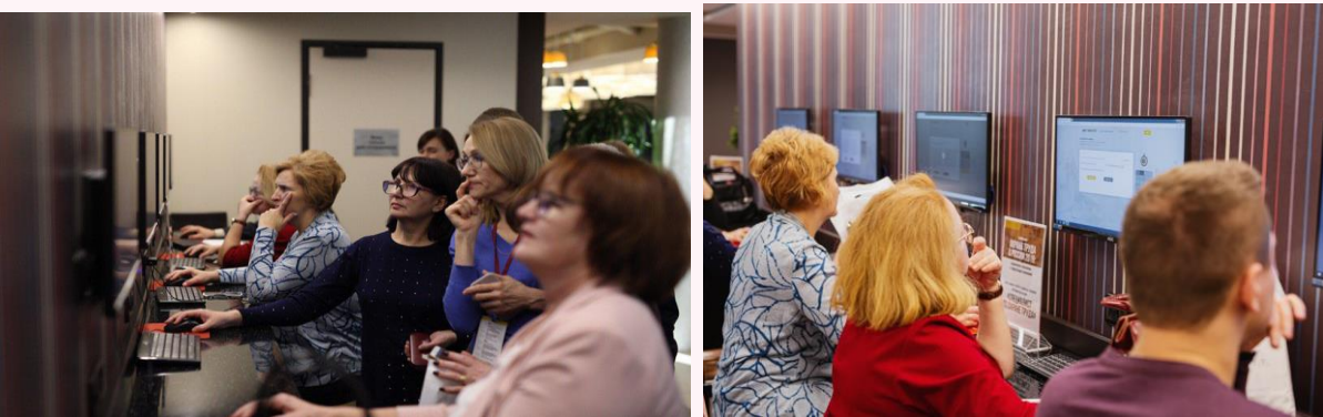
Конференция «Охрана труда в России 2019»