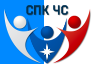
ГРАФИК ПРИЕМА НОК В СУБЪЕКТАХ РФ