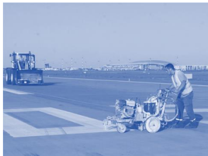
Работник аэродромного обслуживания