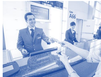
Работник организации пассажирских перевозок